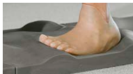
Gangschulung und Therapieübungen nach dem Anpassen einer Silikon-Vorfußprothese.