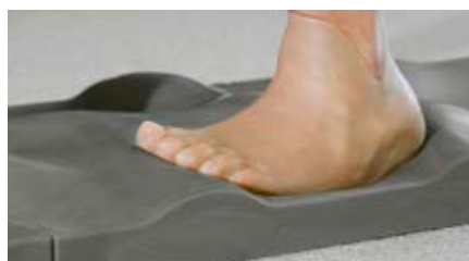
Entrenamiento de la marcha y ejercicios terapéuticos tras la adaptación de una prótesis de antepié de silicona.